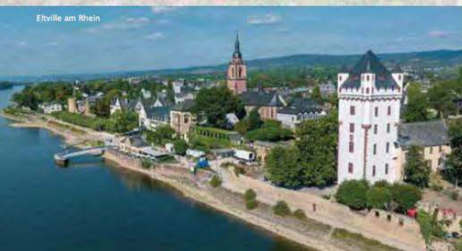
Eltville am Rhein

Das AKZENT Waldhotel Rheingau**** ist ein familiengeführtes Vier-Sterne-Hotel in idyllischer Lage im Herzen der Wein- und Kulturregion Rheingau und befindet sich in unmittelbarer Nachbarschaft zum Kloster Marienthal. Das traditionelle Pilgerhotel blickt auf eine über 150-jährige Geschichte zurück und zeigt sich heute als modernes Erholungshotel mit geschmackvoller Einrichtung. Die Zimmer sind von der Tradition des jahrhundertealten Weinanbaus inspiriert und verfügen über alle Annehmlichkeiten, die man von einem 4-Sterne Hotel erwarten darf. Das Hotel verfügt über einen Wellnessbereich samt Schwimmbad, der gegen Gebühr (inkl. Bademantel und Badetuch) genutzt werden kann. Kostenfreie Parkplätze befinden sich direkt am Hotel.