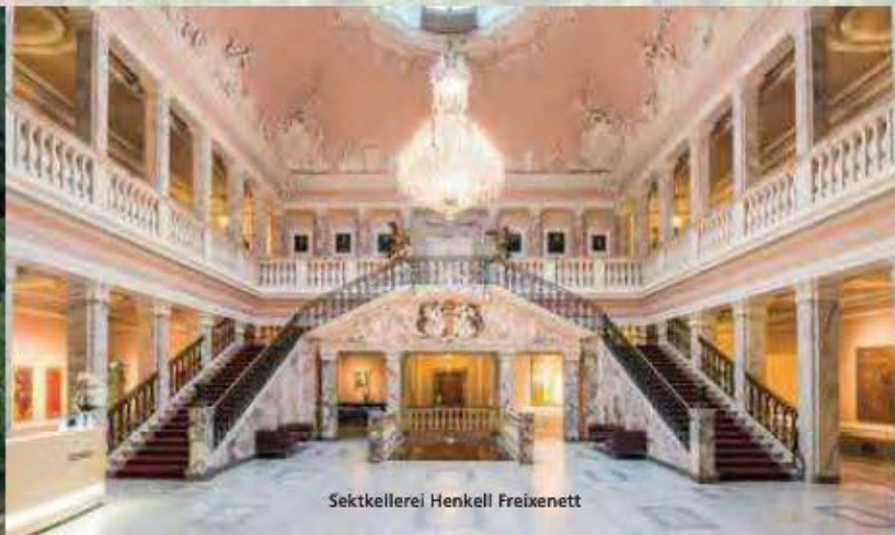
Sektkellerei Henkell Freixenet